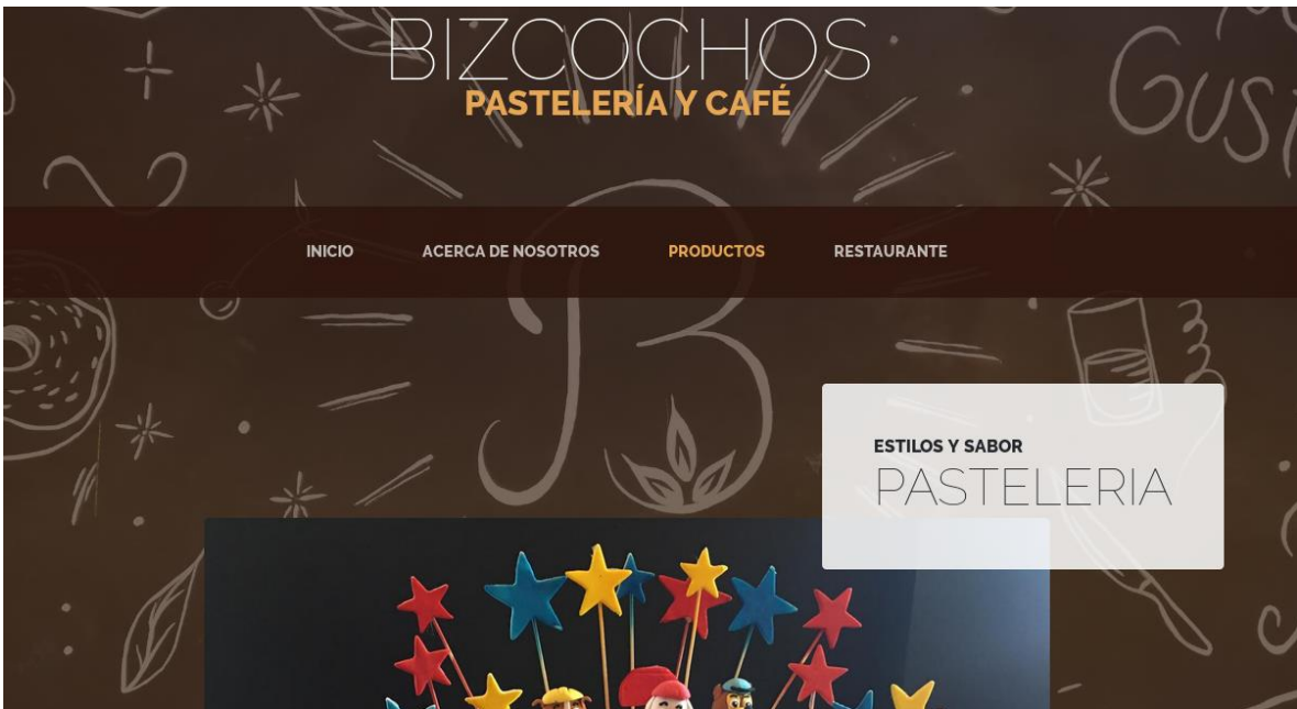
PÁGINA DE "PRODUCTOS"