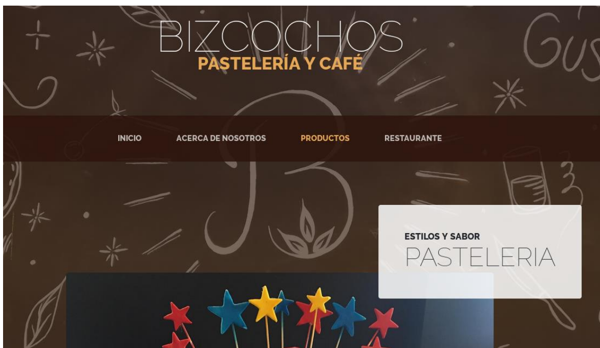
PAGINA DE INICIO.

Diseño y justificación de cada una de las páginas Web.